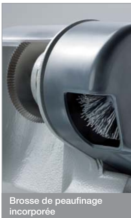
Brosse de peaufinage incorporée