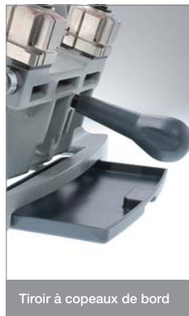
Tiroir à copeaux de bord