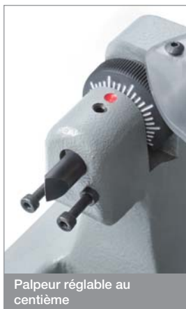
Palpeur réglable au centième