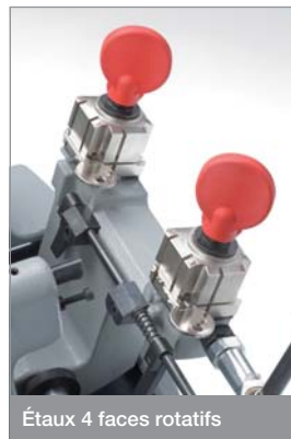
Étaux 4 faces rotatifs

Speed a été développée dans le respect total des normes liées au marquage CE.